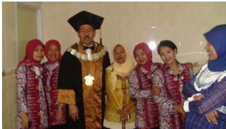
Gambar 4. Sekelompok tenaga kependidikan berkumpul dan ngerumpi di toilet Baruga Andi Pettarani