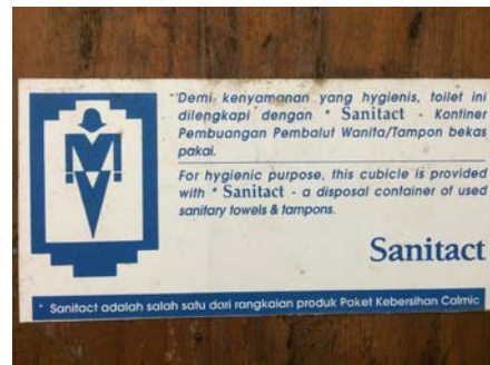
Gambar 2. Gambar dan tulisan dari pemasok kontainer pembalut bekas pakai

Rendahnya perhatian terhadap kepentingan perempuan di toilet-toilet publik Unhas dapat dimaklumi mengingat bahwa: (1) Di Indonesia pembangunan fisik merupakan wilayah kekuasaan laki-laki. Oleh karena itu kebijakan-kebijakan pembangunan fisik sejak perencanaan, pengadaan, pelaksanaan, pembiayaan, hingga penggunaan dan pemeliharaan umumnya hanya melibatkan staf laki-laki. Pada masa kepemimpinan rektor Paturusi yang kedua, beberapa perempuan sudah nampak dilibatkan sebagai anggota Panitia Lelang atau Tim Teknis, tetapi mereka tidak berperan dalam keputusan yang terkait dengan kebijakan detail perancangan; (2) Aktivitas gender di Unhas belum menyentuh pada tuntutan akan kebutuhan ruang bagi keunikan tubuh perempuan.