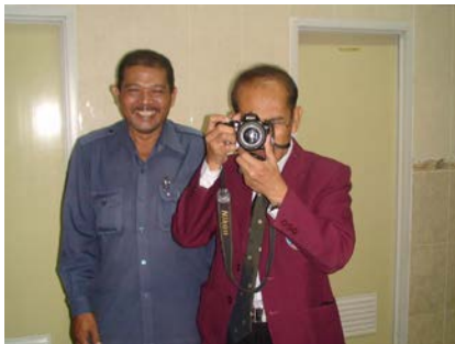
Gambar 5. Seorang tenaga kependidikan dan seorang fotografer laki-laki juga bergabung di hall toilet perempuan.

Saya mencari tahu apakah fenomena yang saya dapatkan ini hanya bersifat khusus saja atau memang berlaku secara umum. Saya kemudian menyusuri toilet-toilet yang punya peluang dijadikan sebagai tempat "ngerumpi". Namun, saya tidak menemukan kelompok pengguna laki-laki yang berada di hal-hal toilet yang melakukan aktivitas ngerumpi di toilet.