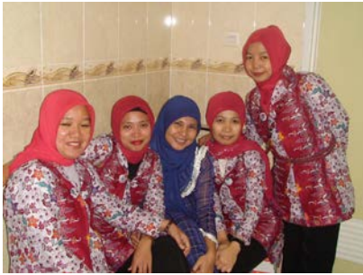
Gambar 3. Sekelompok tenaga kependidikan berkumpul dan ngerumpi di toilet Baruga Andi Pettarani